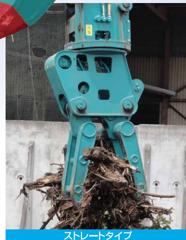
ストレートタイプ